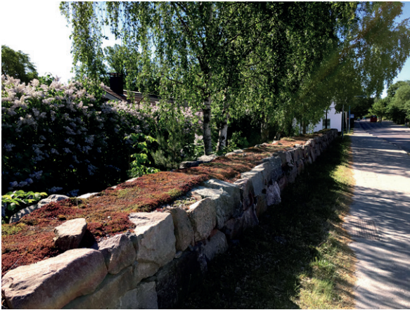
En vacker mur är en tillgång som platsar så gott som överallt.