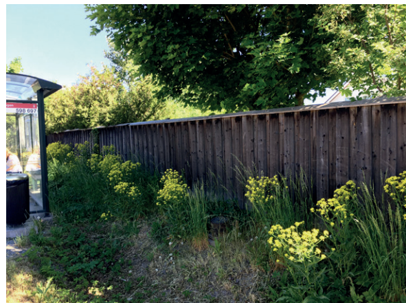
Längs kraftigt trafikerade gator och vid busshållplatser kan högre plank vara befogade. En bedömning av behovet görs i varje enskilt fall.

Om du har grannars medgivande kan du bygga det bygglovsbefriade planket eller muren närmare tomtgränsen än 4,5 m, förutsatt att de andra villkoren är uppfyllda. Medgivanden bör du alltid begära att få skriftligt.