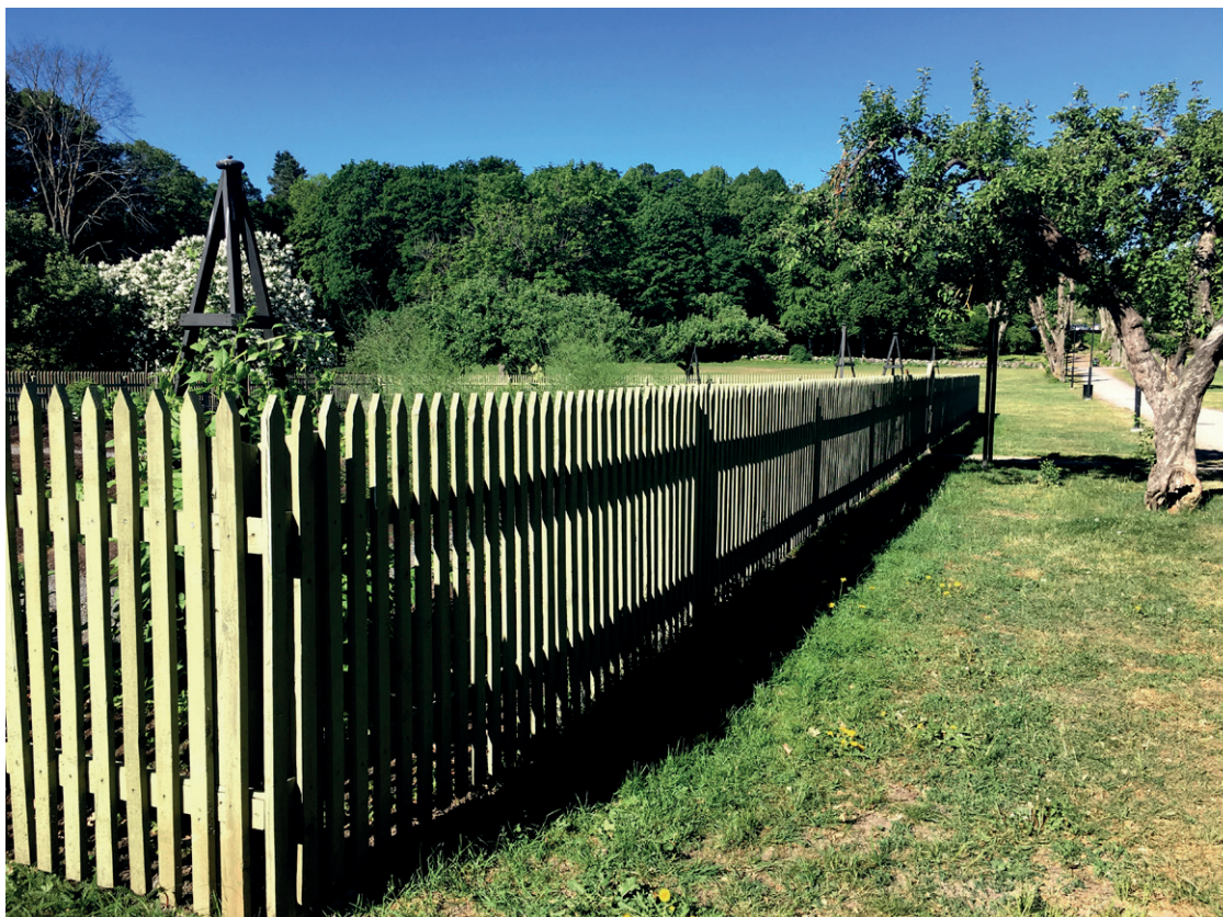
Om staket, murar och plank gestaltas på ett genomtänkt sätt kan de tillföra arkitektoniska värden.