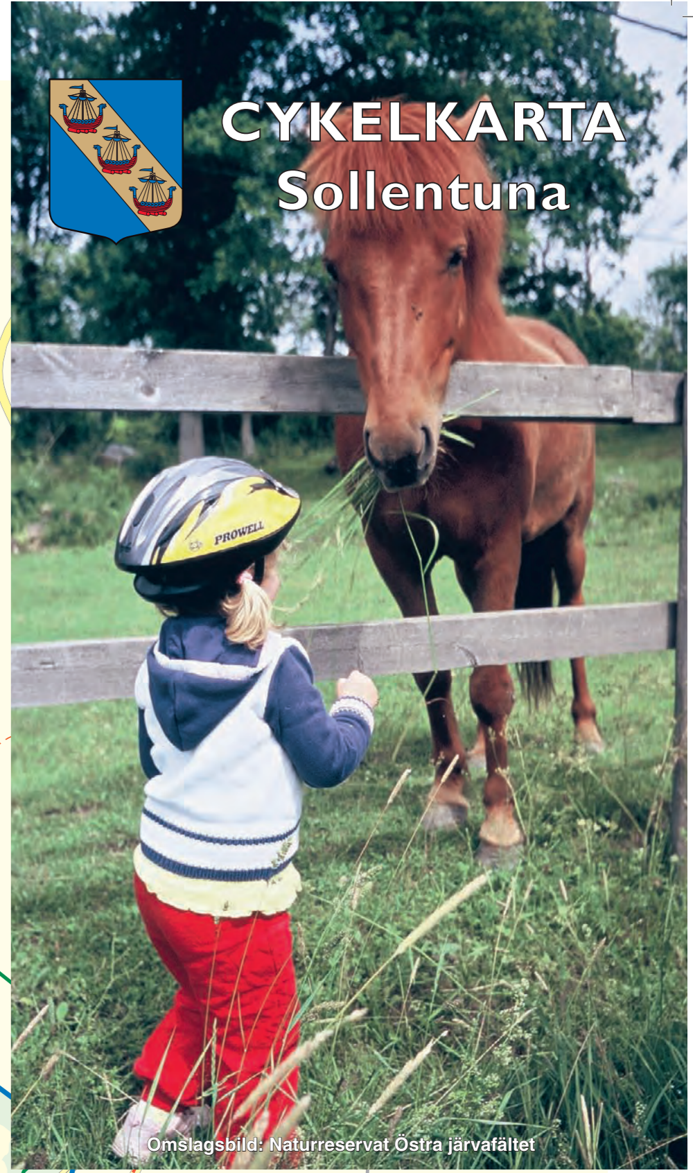
Omslagsbild: Naturreservat Östra Järvafältet