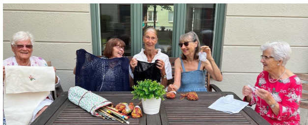
Handarbete vid Turebergs allé