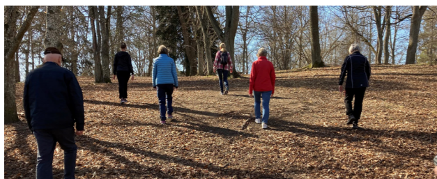
Breathwalk med kommunens anhängstöd