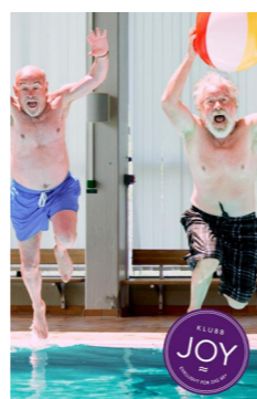
Medley Sollentuna sim-och sporthall