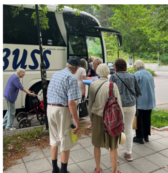
Bussutflykt med kommunens träffpunkter