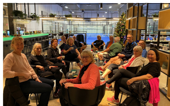
Seniorpadel på LeDap Padelarena i Sollentuna