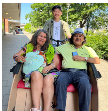
Cykeltaxi på Träffpunkt Malmgården