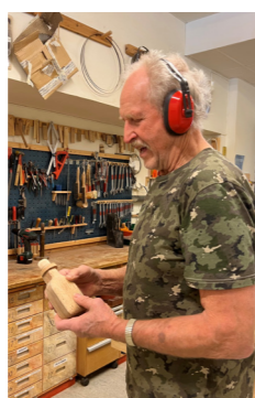
Snickarverkstad Träffpunkt Malmgården