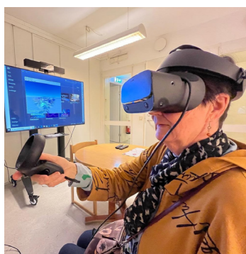
VR, inspirationsrum på Träffpunkt Norrviken