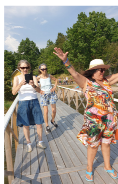
Sommarkolla med Träffpunkterna